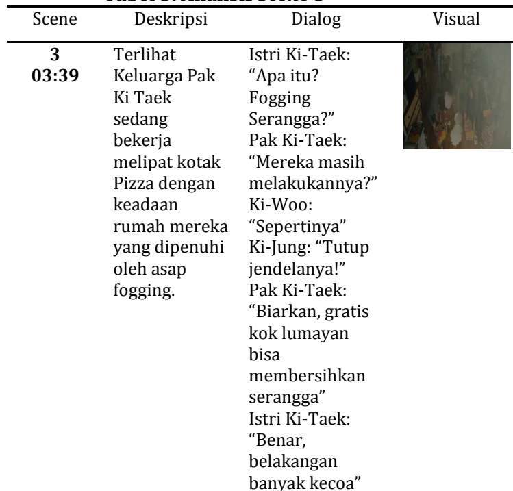
Tabel 3. Analisis Scene 3

dalam hal pemenuhan kebutuhan hidup, sedangkan manusia secara alami memiliki bermacam-macam kebutuhan yang harus dipenuhi seperti halnya kebutuhan primer, sekunder, tertier dan sebagainya.