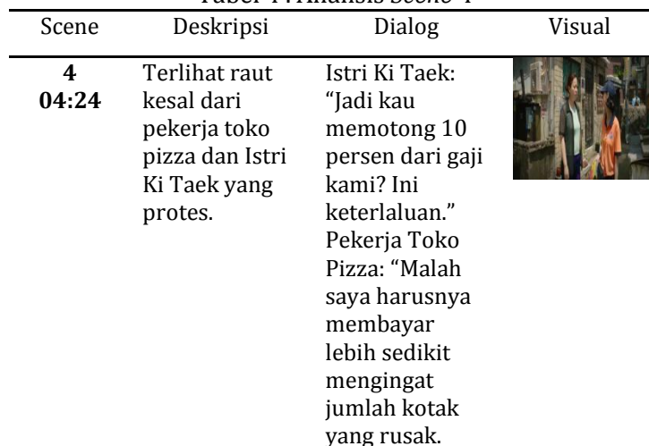
Tabel 4 . Analisis Scene 4

pengangguran pada suatu negara. Pengangguran merupakan masalah sosial bagi masyarakat dari ekonomi miskin yang mengalami ketimpangan kesempatan dalam memperoleh pekerjaan dan juga terjadi karena jumlah para pelamar dan pencari pekerjaan tidak sebanding dengan lapangan pekerjaan yang ditawarkan.