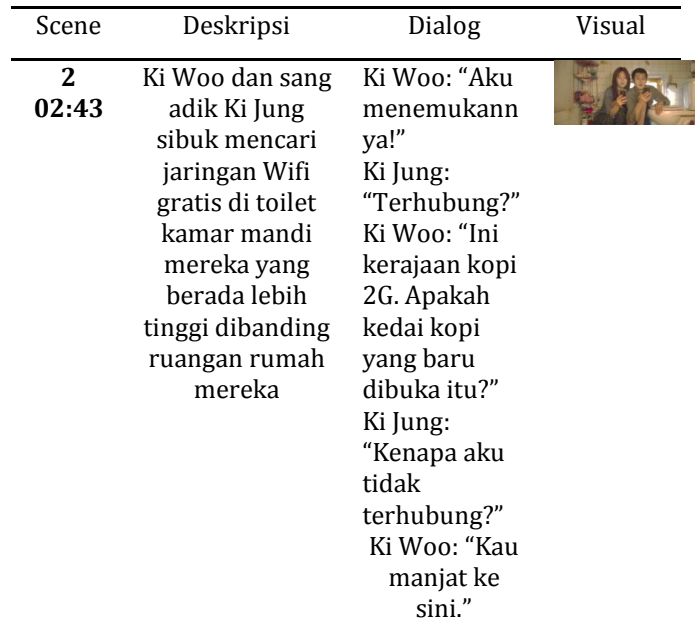
Tabel 2. Analisis Scene 2

Seperti pada kehidupan nyata di Korea, orang-orang yang berasal dari perekonomian rendah akan memilih tinggal di rumah atau kamar semi basement yang disewakan. Apartemen semi basement telah menjadi pilihan yang terjangkau terhadap harga perumahan yang berkembang pesat dengan sewa bulanan sekitar 540.000 won Korea (£ 345; $ 453), dengan gaji bulanan rata-rata untuk orang berusia 20-an sekitar 2 juta won (£ 1.279; $ 1.679).